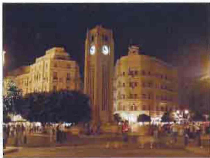
Երեւանի Քլեյրաթ Լիցանի Կարգի Կարգադրանի