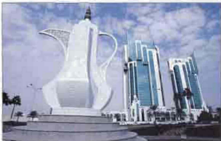
Դնքնատիպ կտրու Դուբայում