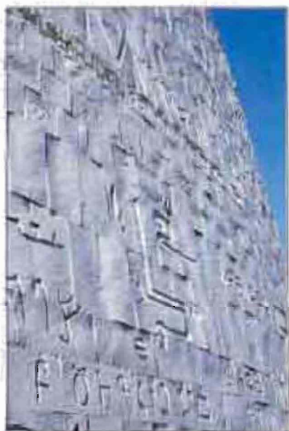
Պայծառ կենտրոն, Արցախյան պատերազմի պատիվ