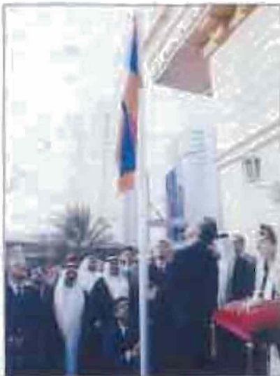
Արո Պաթրոնը ԳԳ ղեկավարներն ըզման արշարտնանան արար- դրությունը յոթն նմուխ է ՀՀ արտ- դրմանարար Վ. Օսկանյանը