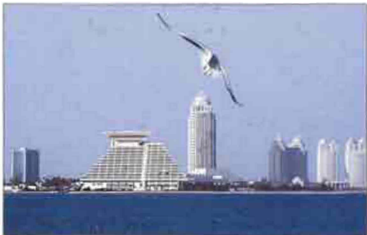
Տնօրան Կառարի Օպերացիոնը Դուբայից