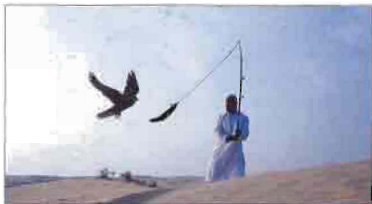
Պարսկ-թուրքական մարտերը կնիտ-ով