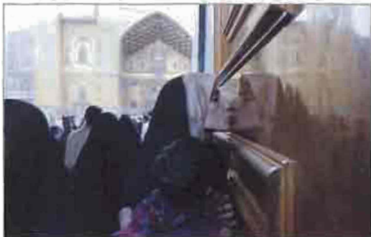
Օրսն Կարճեմբն զուրքի՞ 1 խոսքըսն Շիքի Գնեմք