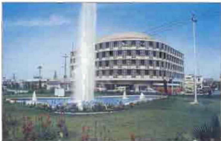
Բիզնես Խառն Նշանակալի Շուք