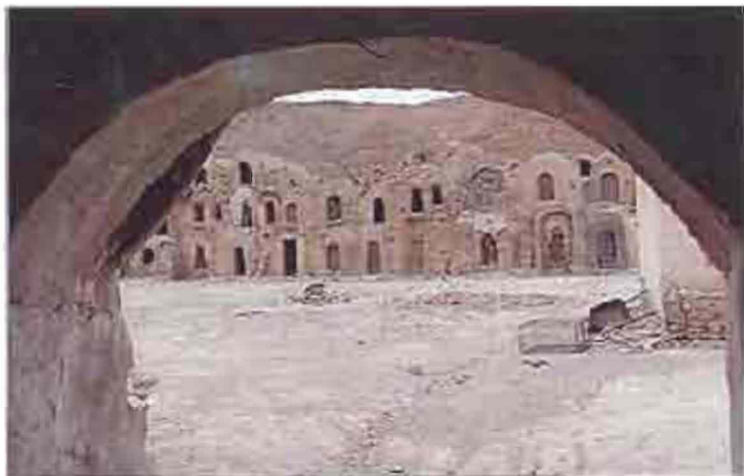
Հին քաղաքի ավերակները Թունիսում