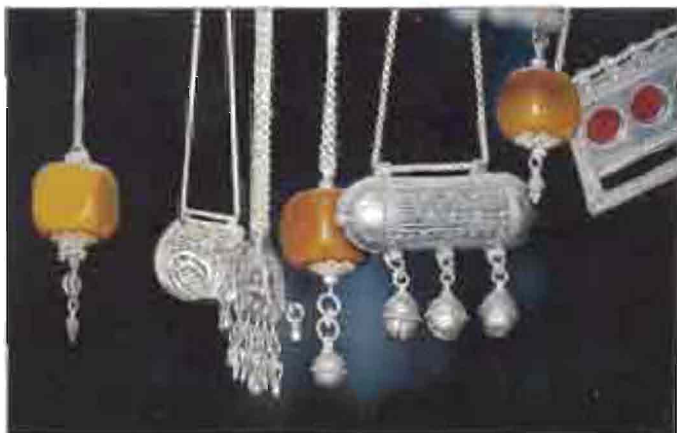
Երևանի Գրգռաբարձրի Ամենի