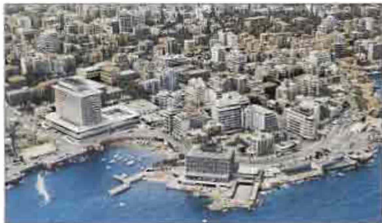
Լիցանանի մայրաքաղաք Քլեյրաթի շէրքանուն սառնիկոյ