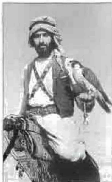
Քաղցրի որսի համար կնիտ միջանկյալներում