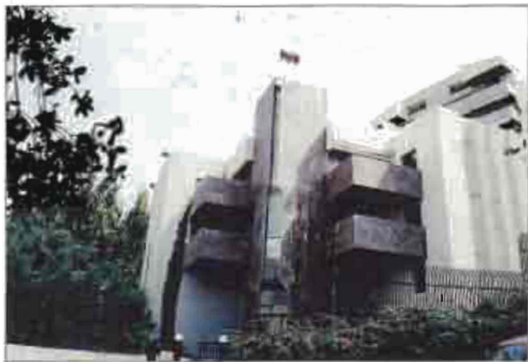
ԿՆ հրապարակապատկերի կենտրոնը