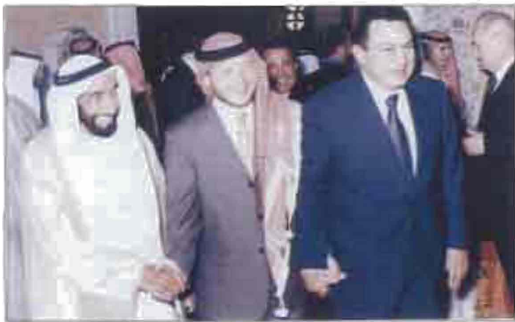
Հրանտ այլ ԱՄՆ-ի Սախարայի շքի ժամկոչ, Գրիգորյանի բազմաթիվ Առաջադաս II-ը 9 Եվրոպական Սահմանադրություն