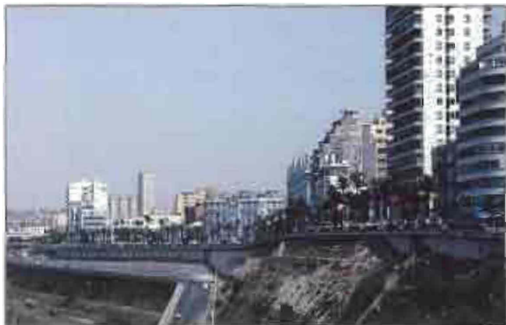
ԱՊԻՐ. Ճարտարապետի արտոնանկից մեկը