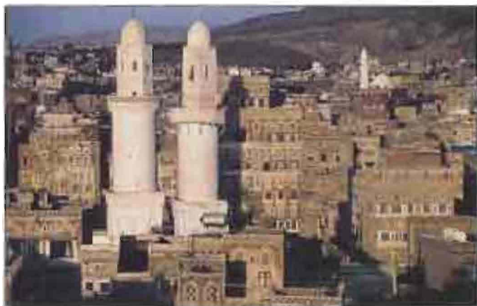
Երևանի Գրգռաբարձրի Ամենի