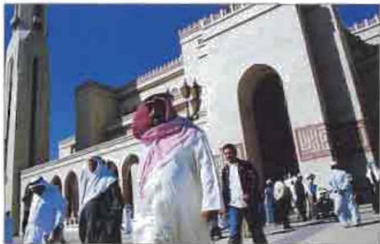
Քաղաքային Առն ճակատ