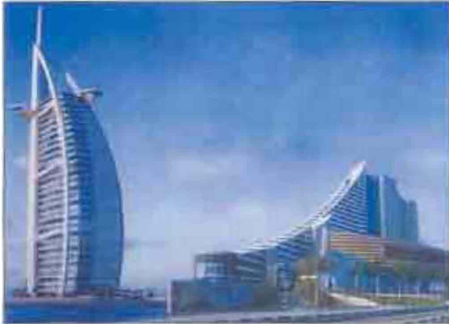
Գոթայ «Իրաքի ԵՊ-Արաբ» բարձրանալու հրաշանդամն Քաճախյոլ