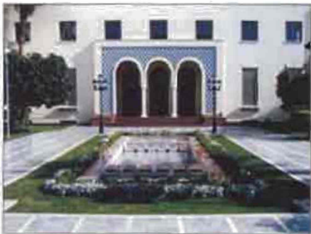
Մասյրական սխարայրոճեթի (քաղաի շրջը տեղադրում)