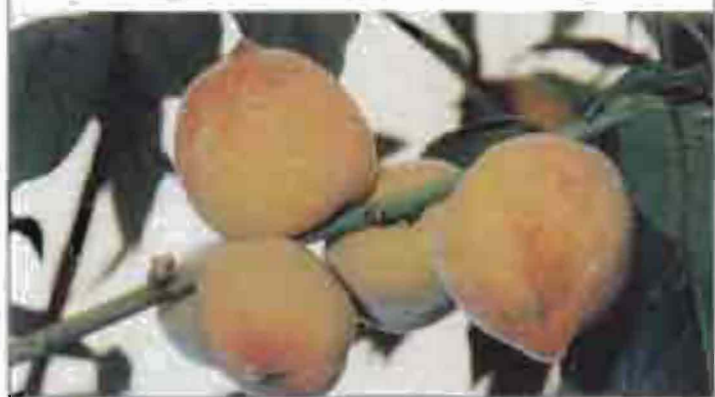
ԱՄԷ՝ ամսանախի համակցը ամհառամանի ժամերու՛ճ