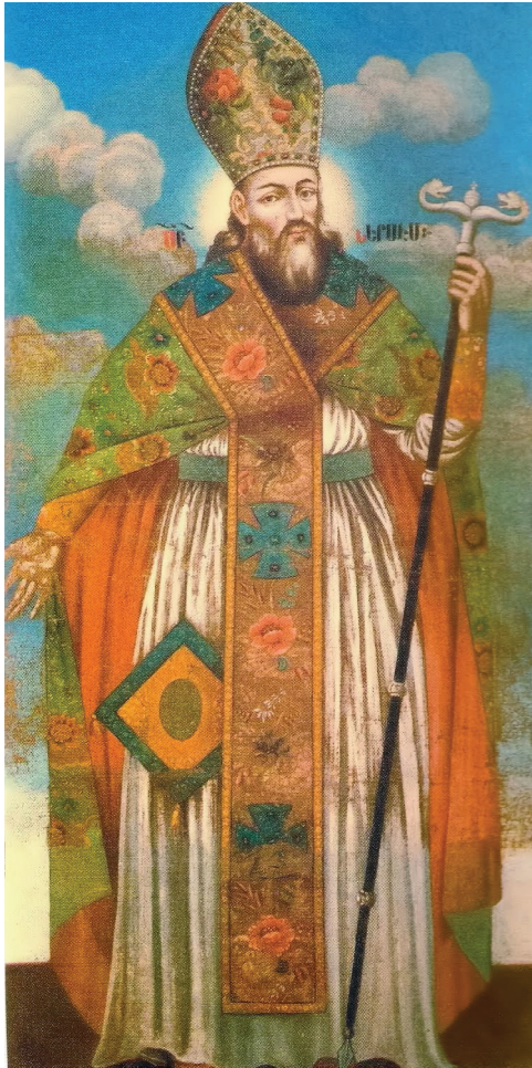
Ներսես Շնորհալի (1166-1173)