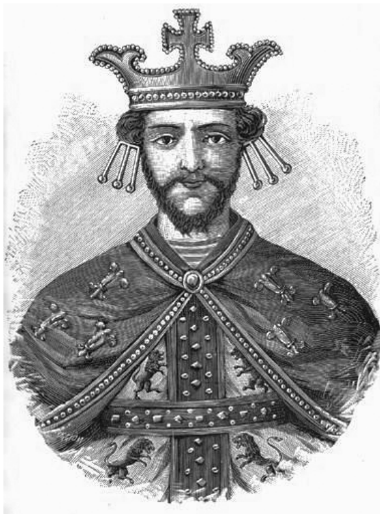
Լևոն Մեծագործ Կիլիկիայի հայոց թագավոր