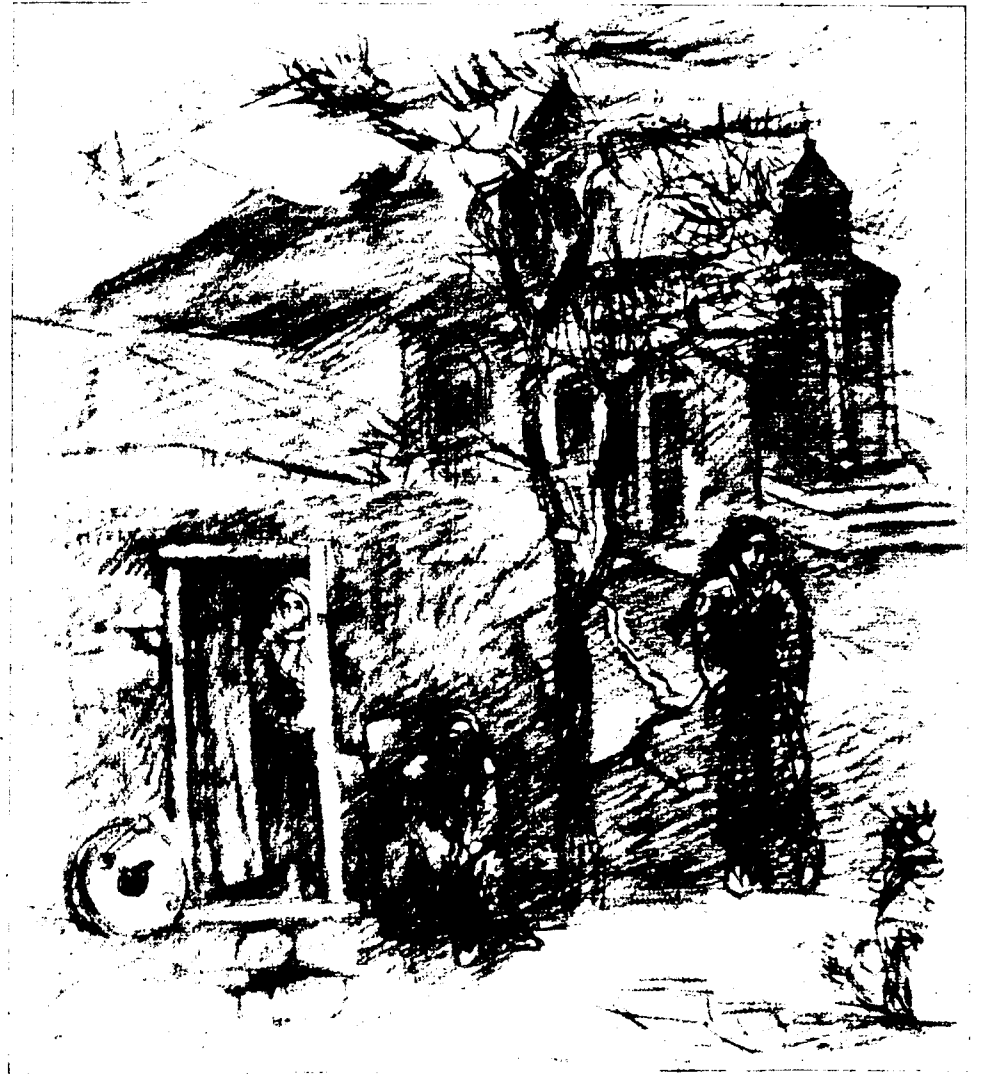
Հայկական գյուղ. 1974 Армянская деревня.