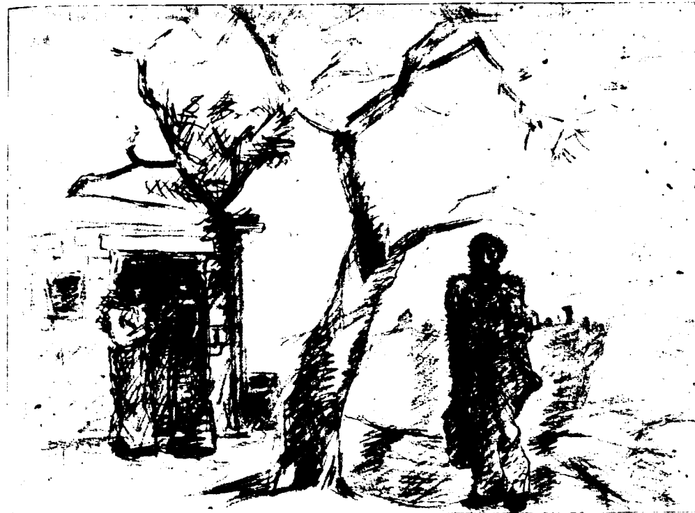
Շիփորդ. 1974 Путник.

Минас прежде всего живописец, но не менее успешно он выступал и в других жанрах изобразительного искусства. Его рисунки, выполненные в различной технике [карандаш, уголь, пастель, тушь, фломастер], привлекают жизненностью и эмоциональностью. Не искажая естественных форм предметов, легко, простейшими, как кладка деревенских каменных изгородей, средствами — переплетением четких незамысловатых линий — художник достигает удивительной выразительности. Вот, к примеру, рисунок «Путник». Его герой — сам художник, чья фигура напряжена и выдает душевное смятение. Это внутреннее состояние создано экспрессией взгляда и движений. Множество графических работ Минаса,