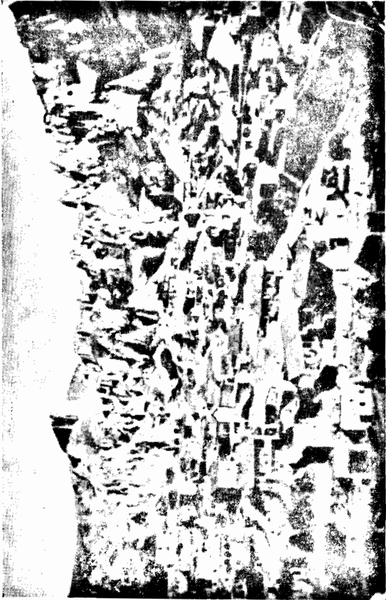
Գաղտնի շինը (Կյարսիք)