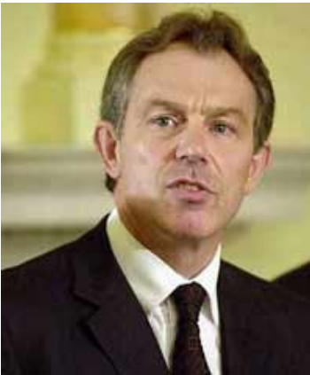
ՏՆԻ ԳՄՇ ԷՆ

Եվ այսպես, 1997թ. մայիսին կայացած ընտրություններից հետո պահպանողականների 18 տարվա իշխանությունը վերջացավ: Իշխանության գլուխ անցան լեյբորիստները Էնտոնի Բլերի գլխավորությամբ: Բլերը լեյբորիստների առաջնորդ է դառնում 1994թ., 40 տարեկան հասակում: Բլերը մարմնավորում էր բրիտանական քաղաքական գործիչների նոր սերունդը: Նա իր հիմնական ճիգերը կենտրոնացրեց լեյբորիստական կուսակցության իմիջի փոփոխման, «նոր» գաղափարախոսության կազմավորման վրա: