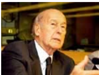
ՎՅԵԻՅ ը ԵՍԵՁԱՅ

Պոմպիդուի մահը դարձյալ սրեց ներկուսակցական պայքարը ՅՈՒՂՈ–ում: «Բարոնների» խմբավորումները նախագահի պաշտոնի համար առաջարկեցին Ժ.Շաբան-Դելմասի թեկնածությունը: «Երիտասարդ գայլերի» առաջնորդները դեռևս պատրաստ չէին առաջարկել միասնական թեկնածու և համաձայնվել փոխզիջման: Հակամարտության