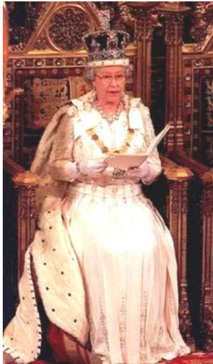
3/4 1/2 μ»Ã II