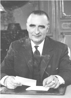
ձ օ՛ւնձ՛ճ՝ օ՛՞

Դը Գոլի հեռացումը գոլական - շարժման մեջ առաջացրեց խորը տարածա-յնություններ: